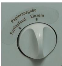
Arbeiten vom Stapel: kontinuierlich oder mit Einzelblattausgabe

Diese äußerst günstige, kompakte und komfortable Tisch-Falzmaschine sollte in keinem Büro fehlen.