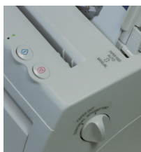
Übersichtliches Bedientableau: Alles Wichtige im Blickfeld