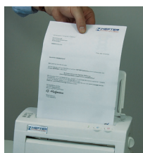
Sammelfalz über separate Tagespoststation